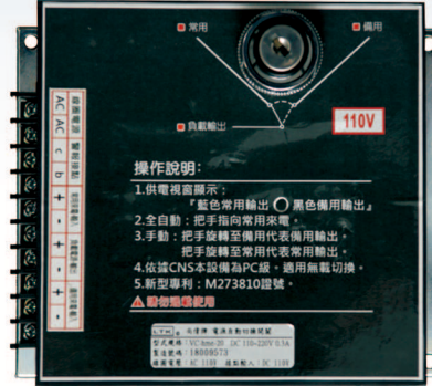
型 式：VC-hmk-20 外型尺寸：132長x167寬x89深mm 面板開孔：133長x137寬mm

性能： 機械壽命：10000次 電氣壽命：10000次 開閉頻度：120/小時 工作電壓：< 75%